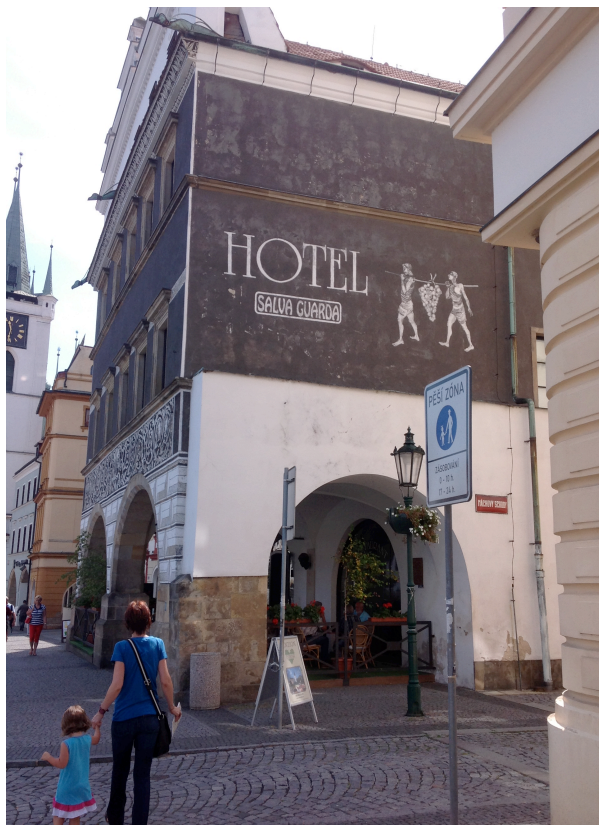
Casa del Águila Negra, actual Hotel Salva Guarda, donde se encuentra la placa y el busto de Rizal