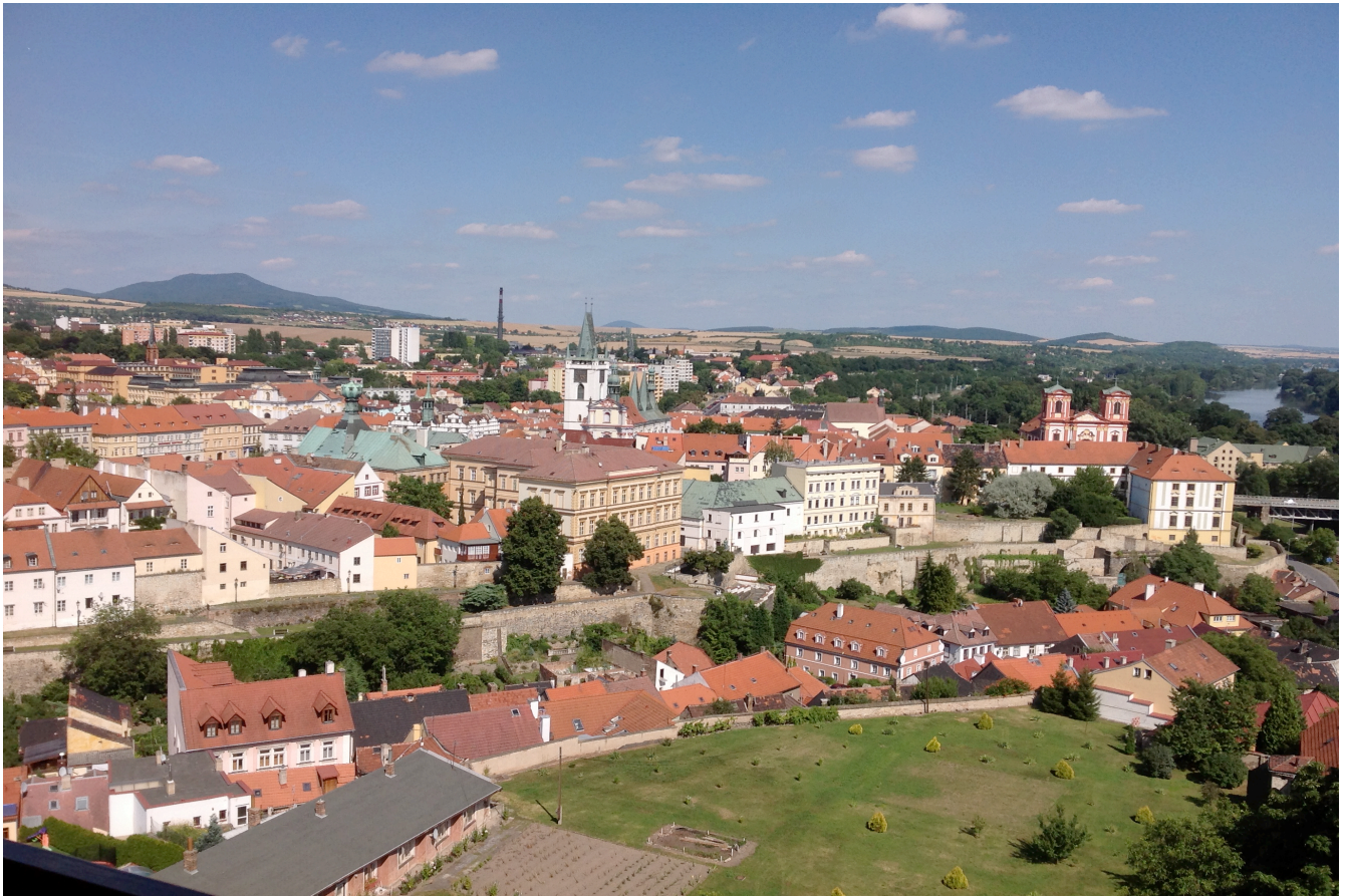
Vista general de Litoměřice / Leitmeritz